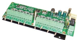
Carte extension 8 zones ref : 6778